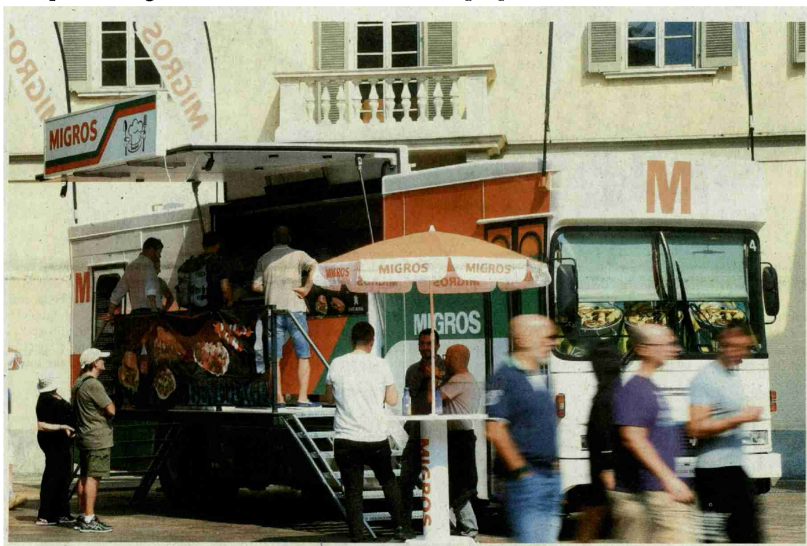
Presso il Camion Vendita Migros «rivisitato» ti aspettano diverse sfiziose creazioni gastronomiche.

Attualità Fino al 23 settembre il mitico Camion Vendita Migros «rivisitato» in chiave catering ti aspetta a Lugano Città del Gusto con sfiziose proposte culinarie